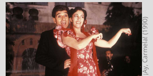
¡Ay, Carmela! (1990)

Cast: Carmen Maura, Andrés Pajares, Gabino Diego.