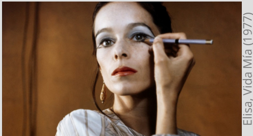
Elisa, Vida Mía (1977)

Ter gelegenheid van de uitreiking van de Goya de Honor aan Carlos Saura op 11 februari, presenteren het Instituto Cervantes en de Radboud Universiteit een cyclus van vier films van de Aragonese regisseur. In de aankondiging van de prijs benadrukte de Filmacademie "zijn uitgebreide en zeer persoonlijke creatieve bijdrage aan de geschiedenis van de Spaanse film van eind jaren vijftig tot nu".