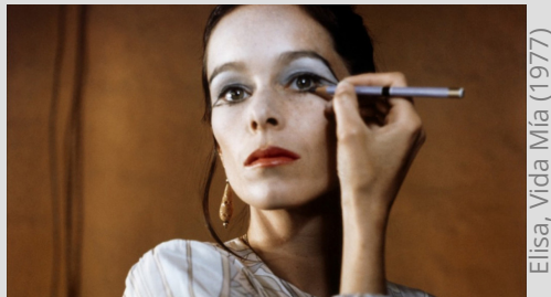
Elisa, Vida Mía (1977)

Con motivo de la entrega del Goya de Honor a Carlos Saura el próximo 11 de febrero, el Instituto Cervantes y Radboud Universiteit presentan un ciclo de cuatro películas del director aragonés. En el anuncio del galardón, la Academia de Cine resaltó “su extensa y personalísima aportación creativa a la historia del cine español desde fines de los años 50 hasta hoy mismo.”