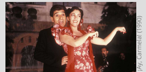
¡Ay, Carmela! (1990)

Reparto: Carmen Maura, Andrés Pajares, Gabino Diego.